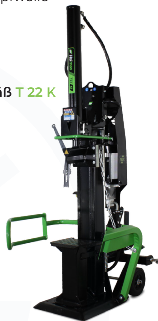
Abb.: REX T 22 KE