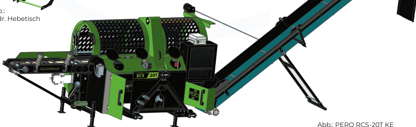
Abb.: PERO RCS-20T KE