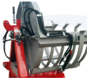
Hydraulische Vorspannung (nur bei Modell 3003)